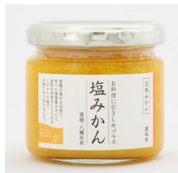
本来は利用されることのない みかんを有効活用した調味料 （農業生産法人 ミヤモトオレンジガーデン）