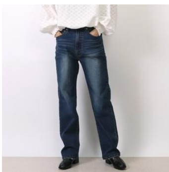
端切れを再利用した リサイクルデニム （佐藤安商店）