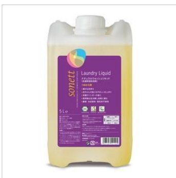
植物原料、ミネラル成分のみ でつくられた洗濯用洗剤 （おもちゃ箱）